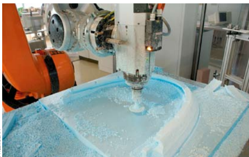
Industrieroboter erledigen das mühsame Fräsen von Gussformen für große Bauteile.