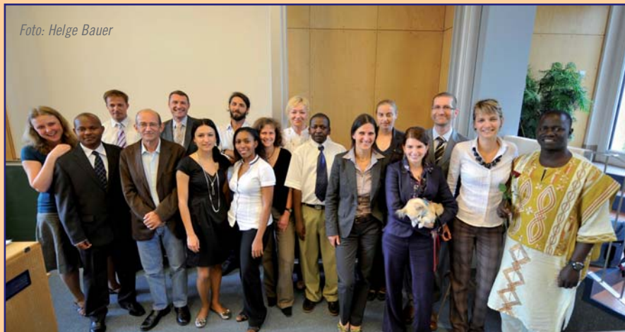
Erfolgreiche „Klagenfurt Days“

Infos und Anmeldung: www.uni-klu.ac.at/iug/unilehrgang