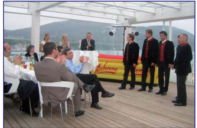
Auftritt des Chors im Rahmen des Gala-Dinners am Wörthersee