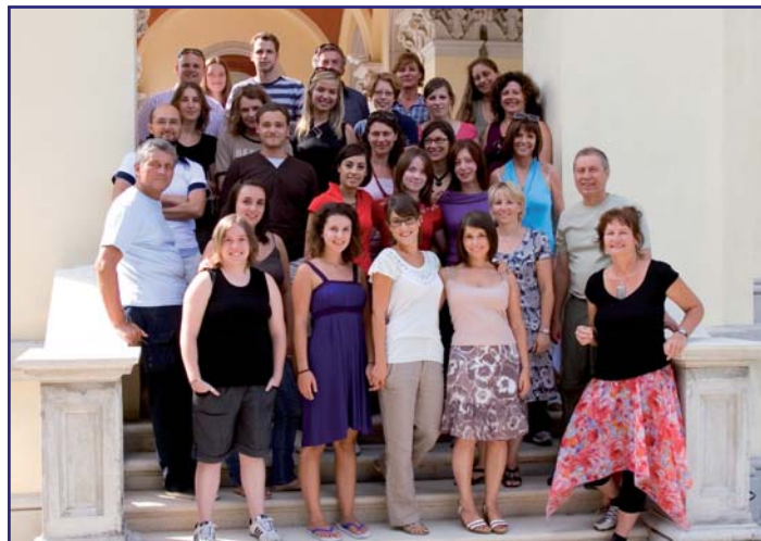
Studierende aus Italien, Slowenien, Kroatien und aus Österreich

Ankündigung: Symposium „Writing across the Curriculum“, 11.-13.11.2009 an der Alpen-Adria-Universität Klagenfurt. www.uni-klu.ac.at/sc . Diskutiert werden u. a.: Wie kann eine kontinuierliche Schreibförderung im Studium gelingen? Wie kann die Arbeit am Schreibstandard in die Einzelfächer integriert und von diesen wahrgenommen werden?