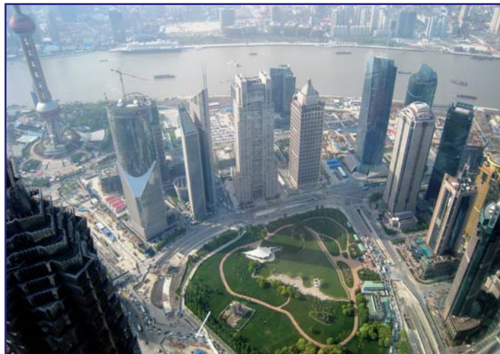
Neues China: Shanghai vom World Financial Center aus, dem höchsten Observatorium der Welt (474 m)