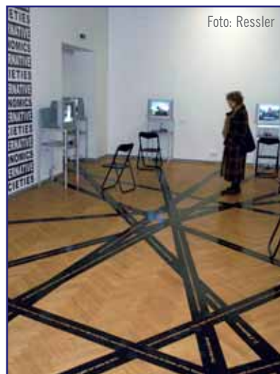
„Alternative Economics, Alternative Societies“, Ausstellungsprojekt von Oliver Ressler, 2003 – 2008 (Installationsansicht: Kunsthooone, Tallinn 2006)

Weitere Informationen finden Sie unter http://ius.uni-klu.ac.at bzw. http://imst.uni-klu.ac.at/gender .