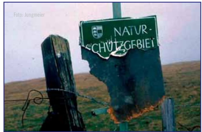
Viele Naturschutzgebiete brauchen dringend finanzielle Ressourcen und ein effektives Management.

Während für prominente Schutzgebiete wie dem Nationalpark Hohe Tauern ausreichende öffentliche und auch private Mittel (Sponsoring, Spenden, Vermarktung lokaler und regionaler Produkte, Tourismus) zur Verfügung stehen, ist eine ausreichende Mittelausstattung für viele kleinere Schutzgebiete z. B. im Kärntner Zentralraum nicht garantiert. Die Ergebnisse des Projekts lassen sich wie folgt zusammenfassen: Die Basis der (privaten) Finanzierung von Schutzgebieten ist die Erfüllung der zentralen (öffentlichen und öffentlich finanzierten) Naturschutz- und ökologischen Managementfunktionen. Effektives ökologisches Management betrifft hauptsächlich die „öffentlichen“ Funktionen von Schutzgebieten. Private Finanzierung ist wahrscheinlicher