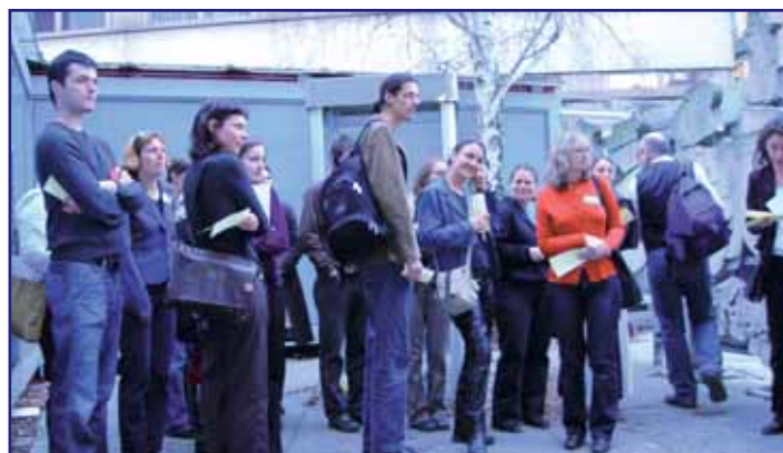
Bei der Abschlussveranstaltung am 30. Jänner 2008 wurden die Ergebnisse des Projektes rund 50 VertreterInnen aus den Bereichen Bildung, Wissenschaft und NGO präsentiert.