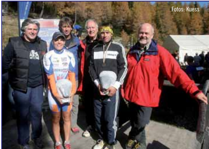
Siegerehrung auf der Klagenfurter Hütte