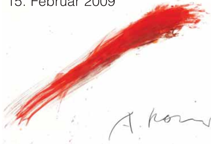
Abb.: Arnulf Rainer Einhandschlag 1973

Burggasse 8, Klagenfurt Di bis So 10 bis 18 Uhr