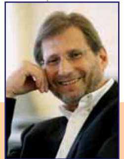
Für UNISONO beantwortete Bundesminister DR. JOHANNES HAHN Fragen zu Autonomie von Universitäten, Zugangsbeschränkungen, Frauenförderung und Hebung der AkademikerInnenquote.

Vorweg, international vergleichen wir hier Äpfel mit Birnen. Die europäischen Länder haben unterschiedliche Fachrichtungen und Berufe akademisiert, die bei uns keine akademische Ausbildung haben, etwa im Krankenhauswesen oder bei den Kindergartenpädagoginnen. Daher haben sie höhere Akademikerquoten als Österreich. Ich will die Quote erhöhen, aber nicht uferlos ohne Aussicht auf Jobs und nicht um einer Quote willen. Russland hat wohl die höchste Akademikerquote, das allein ist aber keine Garantie für einen qualitativ hochwertigen Wissenschafts- und Forschungsstandort, der im internationalen Wettbewerb bestehen will. @