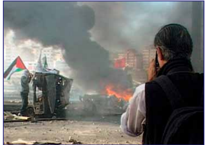
Der Fotograf James Nachtwey – Protagonist des Filmes „The war photographer“ – bei der Arbeit.

Die nächsten Veranstaltungen des Vienna Dialogue on Organizational Development finden am 3. und 4. Juli 2007 und vom 19. bis 21. September 2007 statt. Informationen unter: www.iff.ac.at/oe