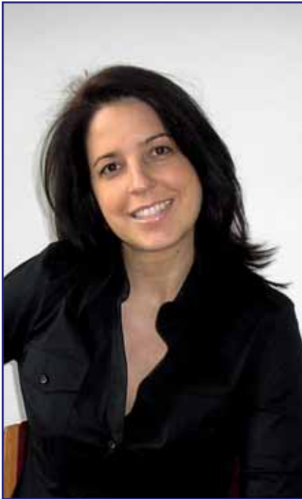
Tomasch: „Schreiben soll Strategie sein“